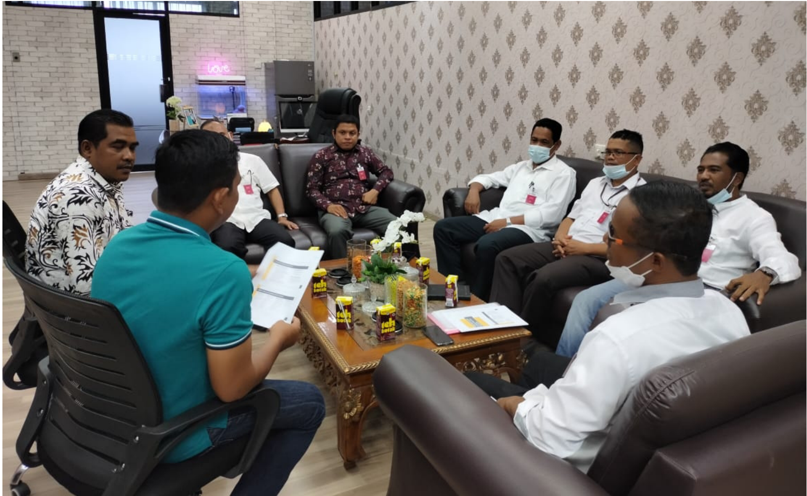
Implementasi Link & Match, JTM PNL dan PLN UP3 Lhokseumawe menjalin kerjasama